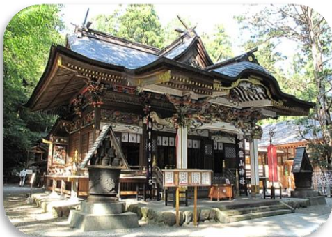
宝登山神社 (長瀬町) Hodosan Shrine ( Nagatoro town )