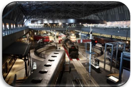
鉄道博物館 (さいたま市) The Railway Museum ( Saitama city )