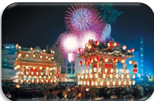
秩父夜祭 (秩父市) Chichibu Night Festival ( Chichibu city )