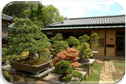
大宮盆栽村 (さいたま市) Omiya Bonsai Village ( Saitama city )