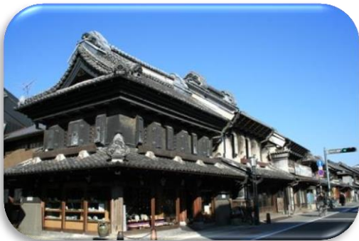
蔵造りの町並み (川越市) Street with Japanese-Style Warehouses ( Kawagoe city )

Furthermore, Saitama has a lot of must-see spots and events including "Hodosan Shrine" in Nagatoro which was selected by the Michelin Green Guide and "Chichibu Yomatsuri."