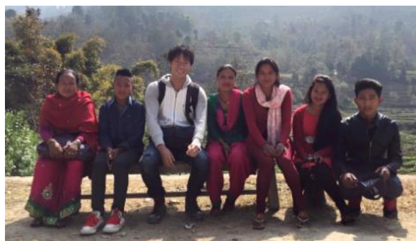
写真1：ネパールのバス停で

その後、大学で地理学を専攻し、都市について勉強します。アルバイトでお金を貯めては海外旅行に飛び出す、国内や海外の街を訪れては、レポートを書くという何とも自分の興味とマッチした専攻でした。ちなみに十代の頃から行き始めた海外旅行は、社会人になった現在でも続けており、20代で世界50カ国・200以上の街を訪問。私の青春時代の時間とお金は、まさに世界中の街に消えていきました。