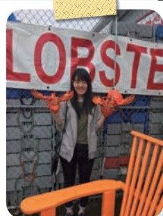
ロブスターが有名なカナダ！

英語には日本にはない発音が沢山あり、現地では苦労をしました。ただ、留学に来なければ自分が正確な発音をできない事に気付かなかっただすし、ホストファミリーに正しい発音を教えてもらった事で語学力が飛躍的に上達しました。