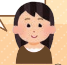
Hさん H28 (学)