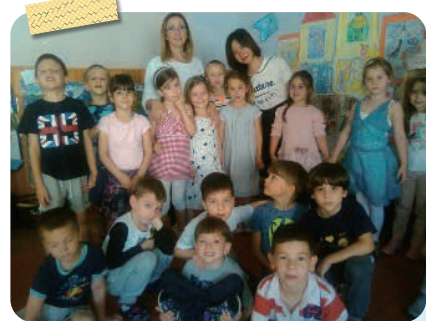
教育実習の子ども達とともに