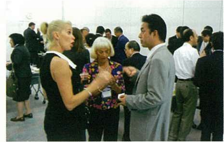
2012.6.4 開催 交流会の様子

豪州企業と県内企業の47名もの皆様にご参加いただき、交流の「第一歩」として新たな絆が生まれました。