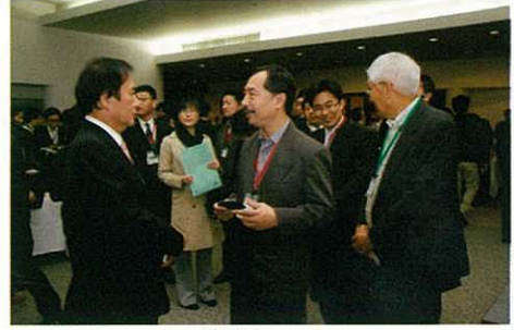
2011.11.28 開催 県知事と参加者が歓談する様子

147名もの皆様にご参加いただき、「グローバル」をキーワードとして交流を深めていただきました。