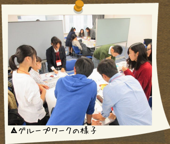
▲グループワークの様子