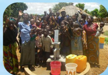
ハンドポンプに集まる村人たち(ザンビア)