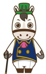
浦和競馬オリジナルキャラクター ウラワール

また県とさいたま市には昭和52年の組合設立から令和5年度までで約148億4千万円の配分金を拠出し、このうち令和5年度分は約8億6千万円(県/約6億6千万円、さいたま市/約2億円)となっており、埼玉県では乳幼児医療費助成、さいたま市では小学校の施設改修に活用されています。