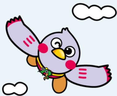
埼玉県マスコット「さいたまっち」