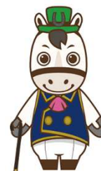
浦和競馬オリジナルキャラクター ウラワール

また県とさいたま市には昭和52年の組合設立から令和6年度までで約157億1千万円の配分金を拠出し、このうち令和6年度分は約8億7千万円(県/約6億7千万円、さいたま市/約2億円)となっており、埼玉県では乳幼児医療費助成等、さいたま市では小学校の施設改修等に活用されています。