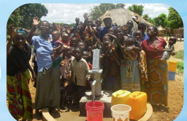
ハンドポンプに集まる村人たち（ザンビア）